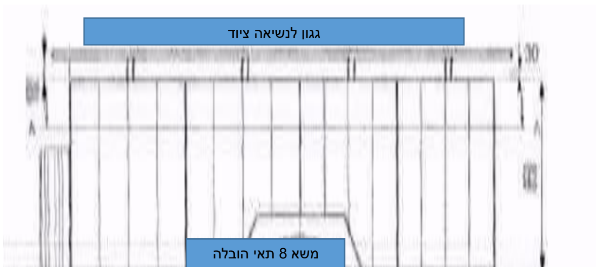
משא 8 תאי הובלה